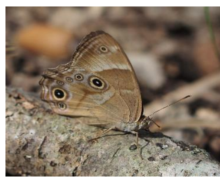
今日のチョウー3:ヒカゲチョウ