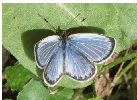
今日のチョウー4:ヤマトシジミ