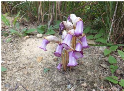
咲き残りのナンバンギセル