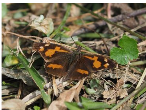
今日のチョウー2:テングチョウ