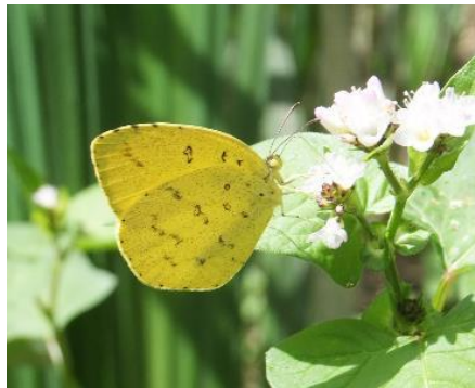
今日のチョウー1:キチョウ