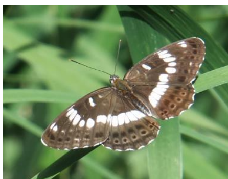
今日のチョウー5:アサマイチモンジ