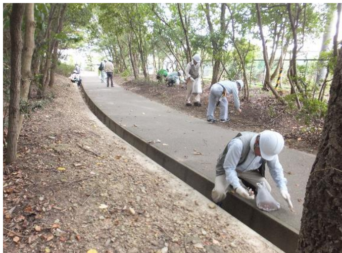
ドングリ拾いの様子(その2)