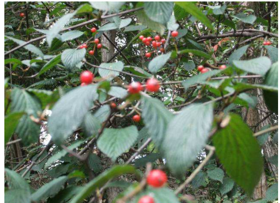
ミヤマガズミの実