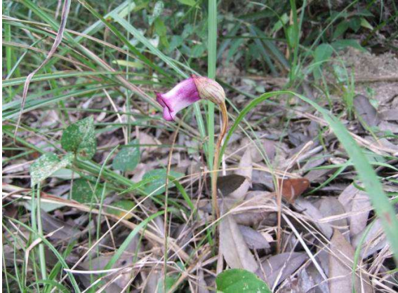
大半が枯れていましたが、一本だけ咲いていた「ナンバンギセル」