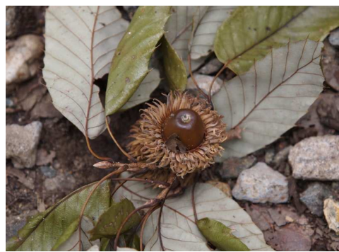
アベマキ 今年のドングリは小さく少ないように感じます。