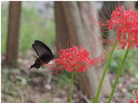
ヒガンバナとクロアゲハ