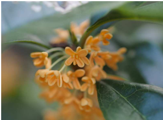
キンモクセイの花