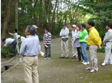
公園の植生 整備方法 植生調査などの 説明を聞きました。