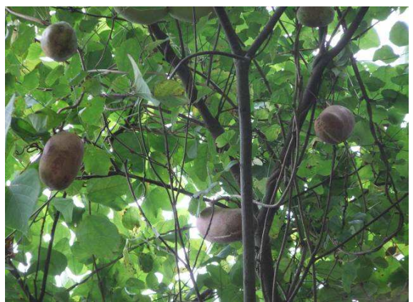
ミツバアケビの実 食べごろです