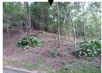
見違えるように綺麗になりました