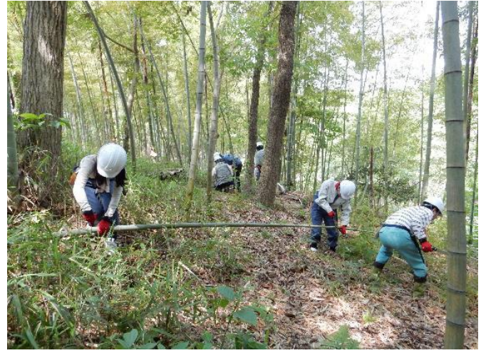
竹林の間伐作業(その1)