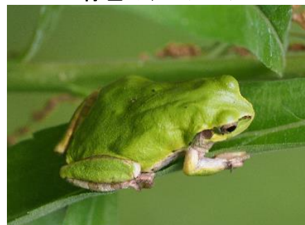
緑色のアマガエル