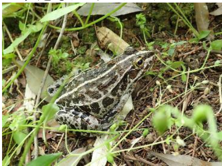
大きなトノサマガエル