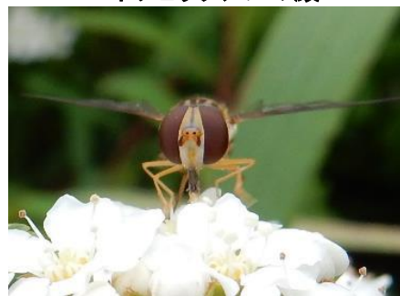
ホソヒラタアブの顔