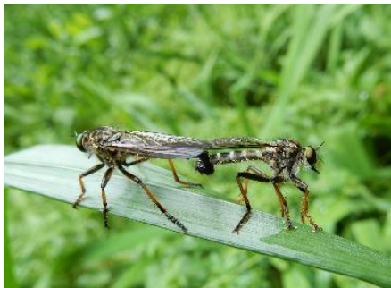
交尾中のムシヒキアブのなかま