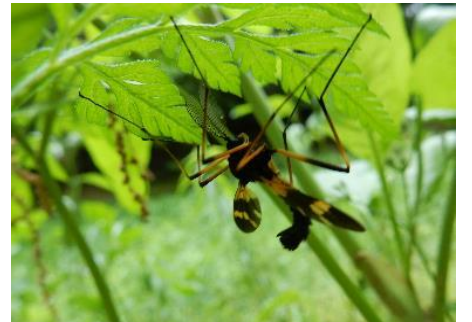
ベッコウガガンボ