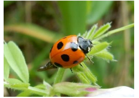
ナナホシテントウ