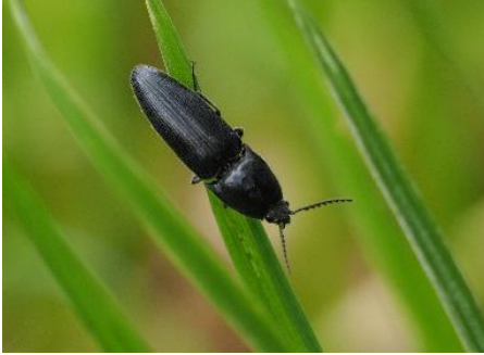
クロツヤハダコメツキ