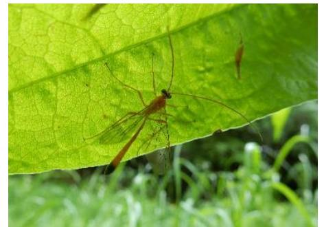
イッシキツマグロアメバチ