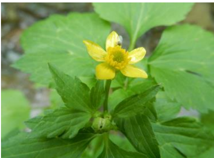
ケキツネノボタンの花