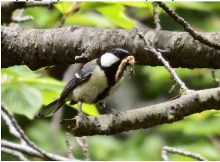
餌をくわえたシジュウカラ