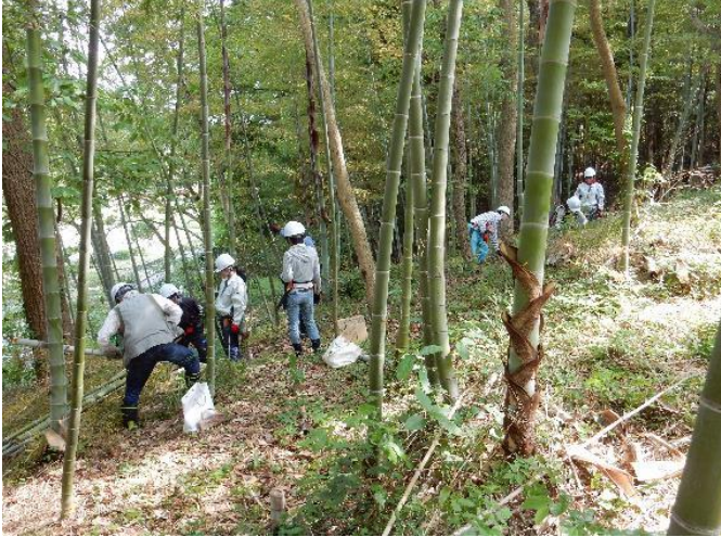
竹林の間伐作業(その2)