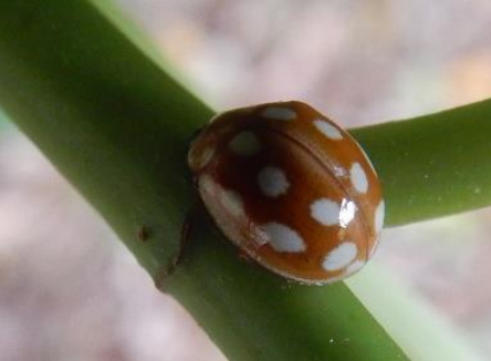
ムーアシロホシテントウ