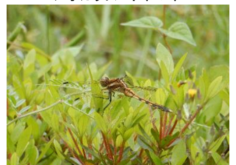
シオカラトンボ(メス)