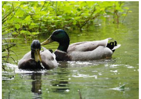
くすんだ色になったマガモ