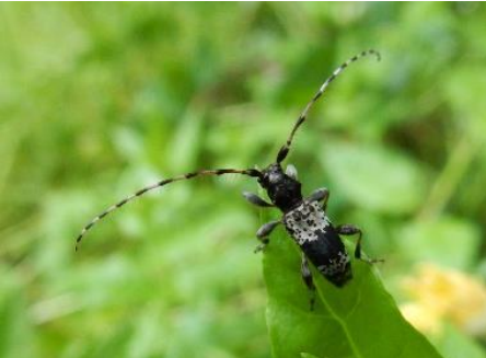
ヒトオビアラゲカミキリ