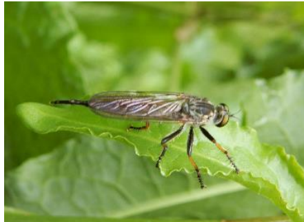
ムシヒキアブのなかま