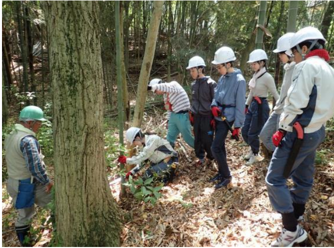
竹林間伐の要領の説明を聞く学生たち