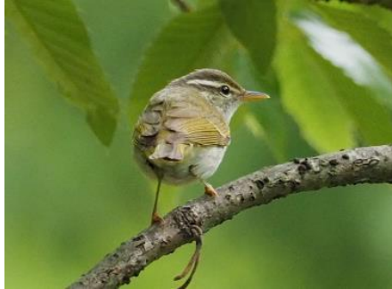
センダイムシクイ