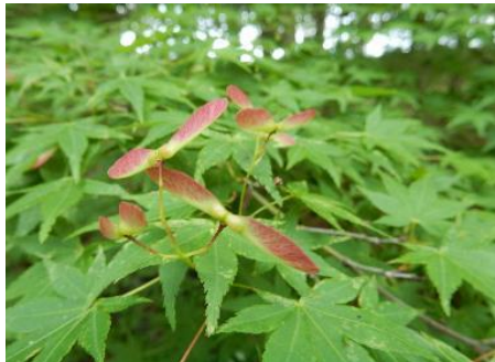
イロハモミジの若い種子