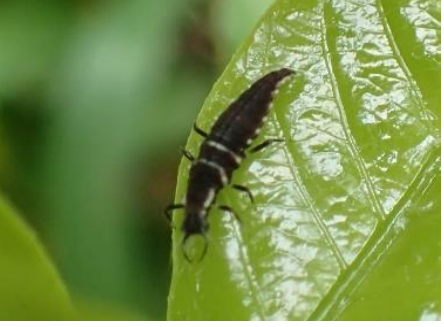
クサカゲロウのなかまの幼虫