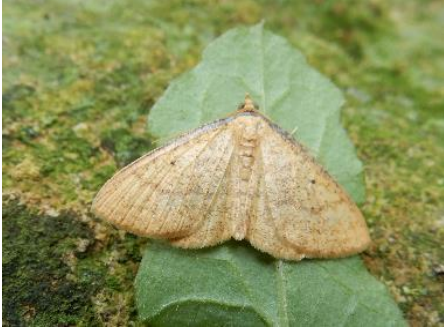
クロハグルマエダシヤク