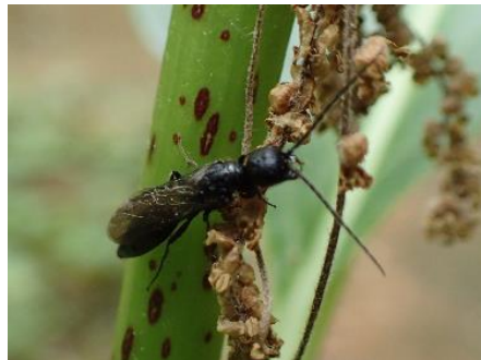
アリガタバチのなかま