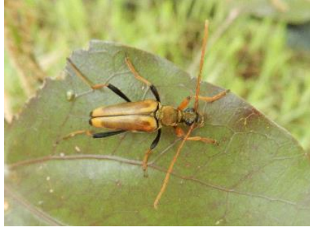
ツماغロハナカミキリ