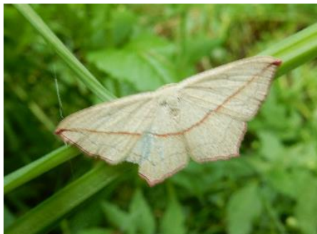
コベニスジエダシヤク