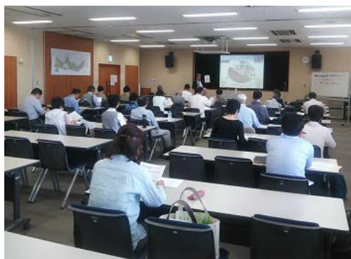
エネルギーセミナーの様子