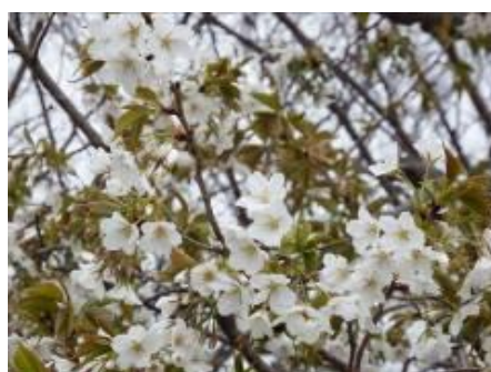
オオシマザクラの花