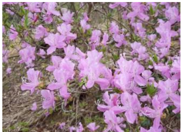
コバノミツバツツジの花(その2)