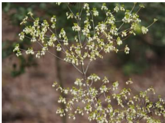
ドウダンツツジの花