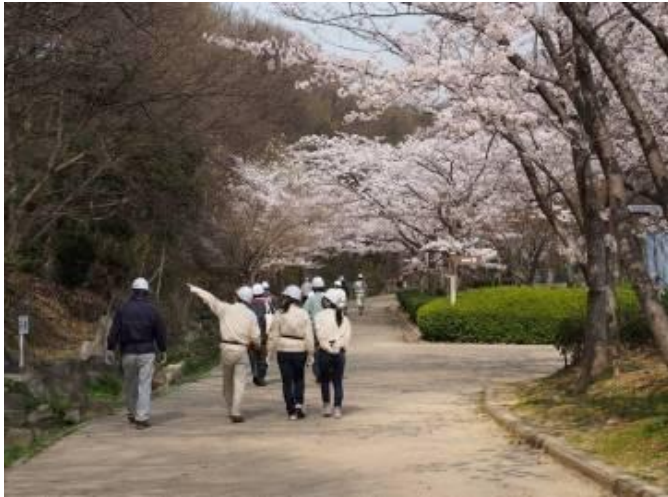
作業を終え、満開の桜の下を吹き上げるメンバー