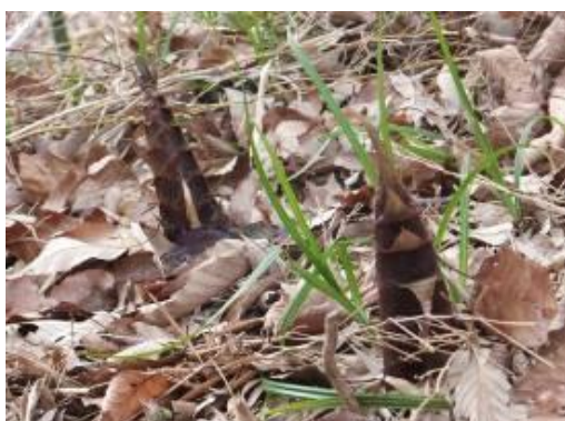
頭を出していたタケノコ