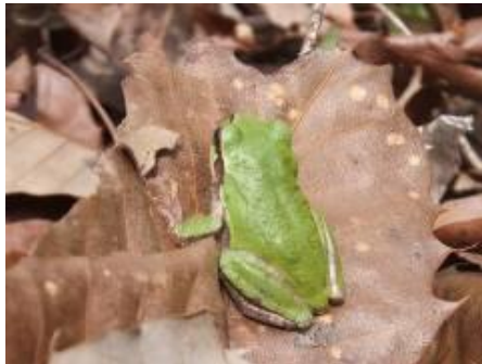
緑色のアマガエル