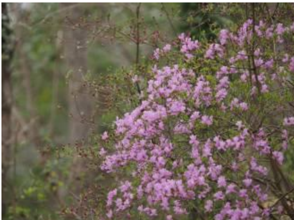
コバノミツバツツジの花(その1)