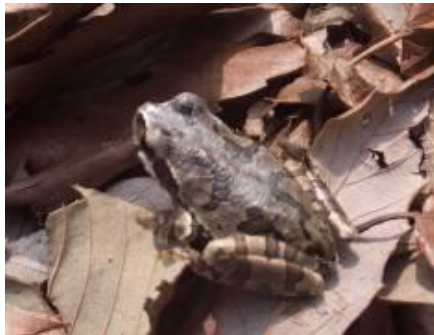
褐色のアマガエル