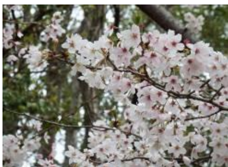
満開のソメイヨシノ