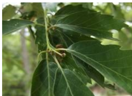
コナラの小さなどんぐり