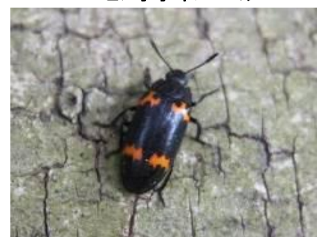
ヒメオオキノコムシ