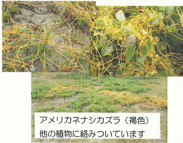
アメリカネナシカズラ (褐色) 他の植物に絡みついています