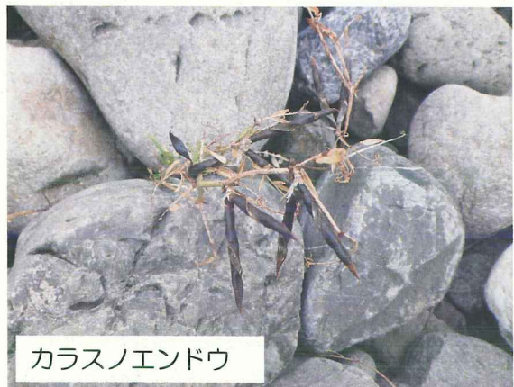
カラスノエンドウ