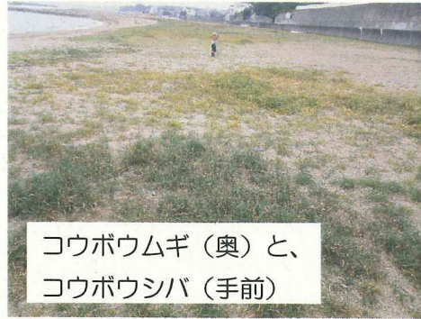
コウボウムギ (奥) と、 コウボウシバ (手前)