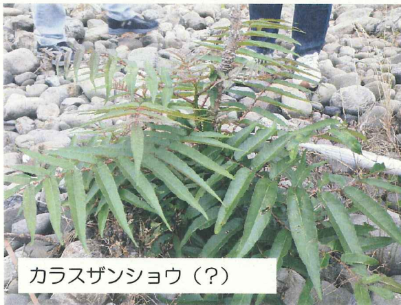
カラスザンショウ（？）