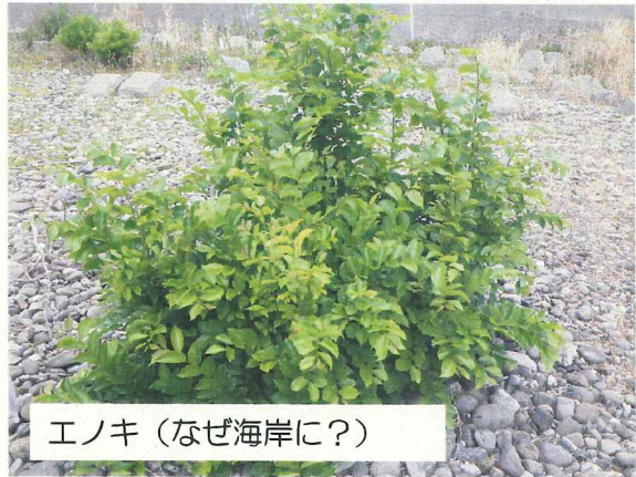
エノキ（なぜ海岸に？）