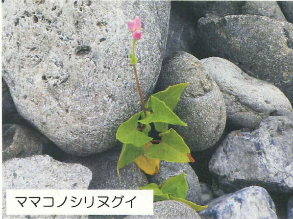
ママコノシリヌグイ