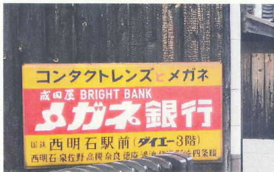
レトロなホーロー看板 (藤江の街並み) 国鉄の表記が・・・。