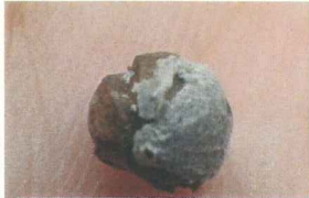
ハマゴウの種（昨年のも）甘い香り