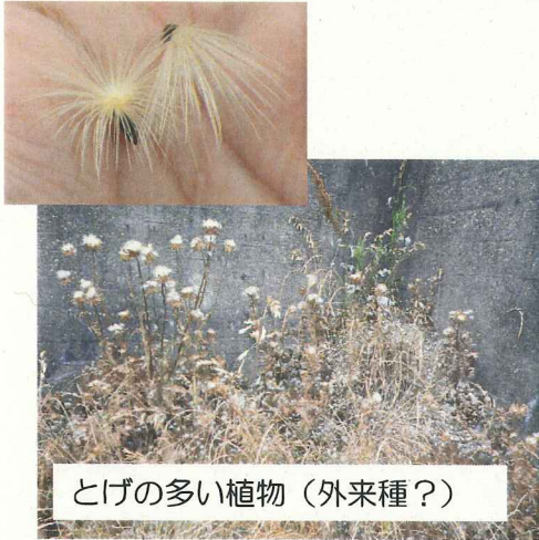
とげの多い植物 (外来種?)