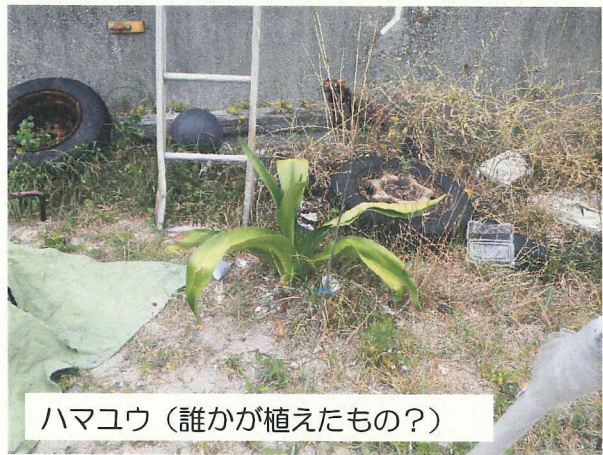
ハマユウ (誰かが植えたもの?)