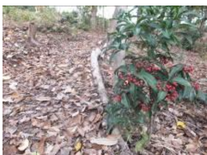
散策路わきのマンリョウの実