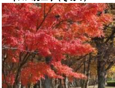
イロハカエデ(その1)