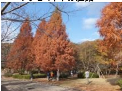
メタセコイヤの紅葉