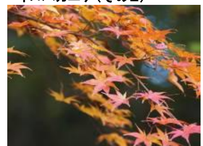
イロハカエデ(その2)