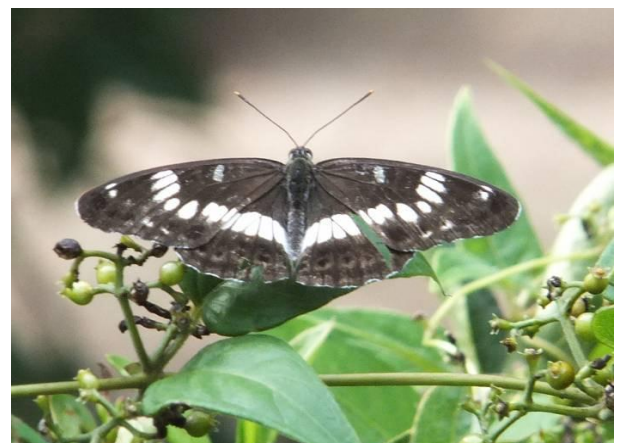
イチモンジチョウ