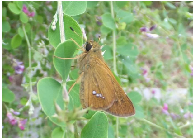
オオチャバネセセリ