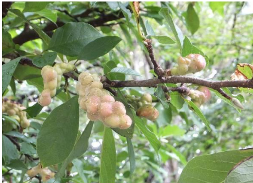
アカメガシワの実