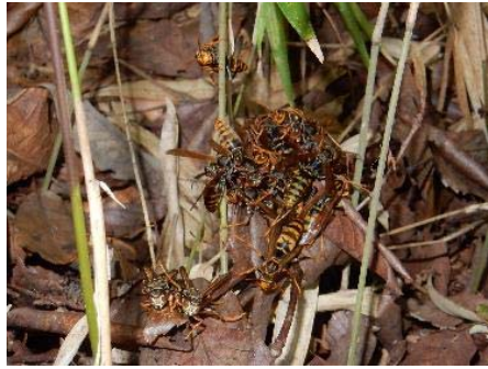
下草の間のアシナガバチの群れ