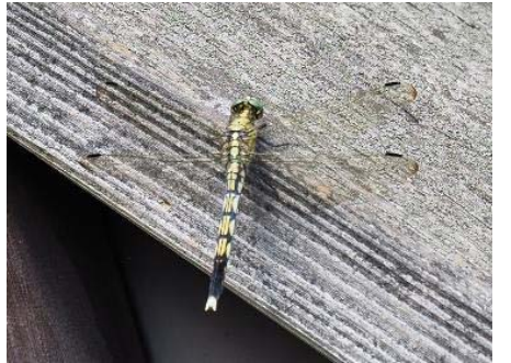
シオカラトンボ(メス)