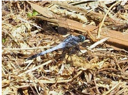
シオカラトンボ(オス)