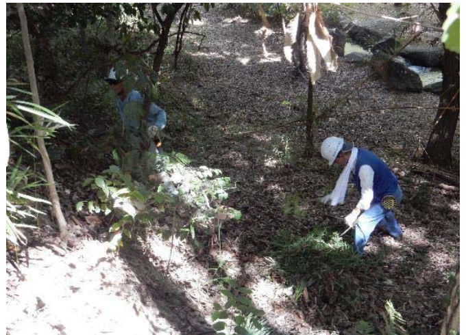
里山の下草刈り作業