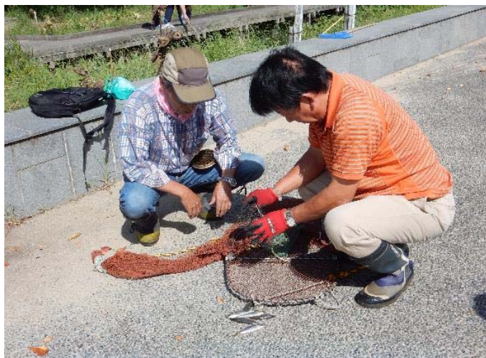
おとりの「アジ」で捕獲網の準備