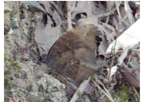
クロコノマチョウ