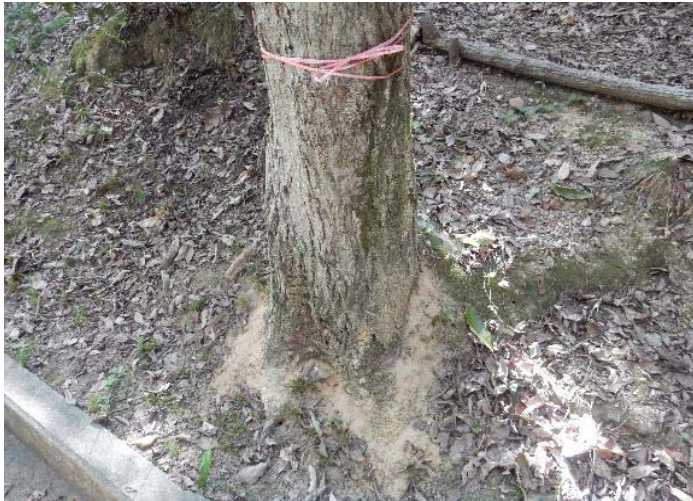
ナラ枯れ被害木の根元にたまった木の粉