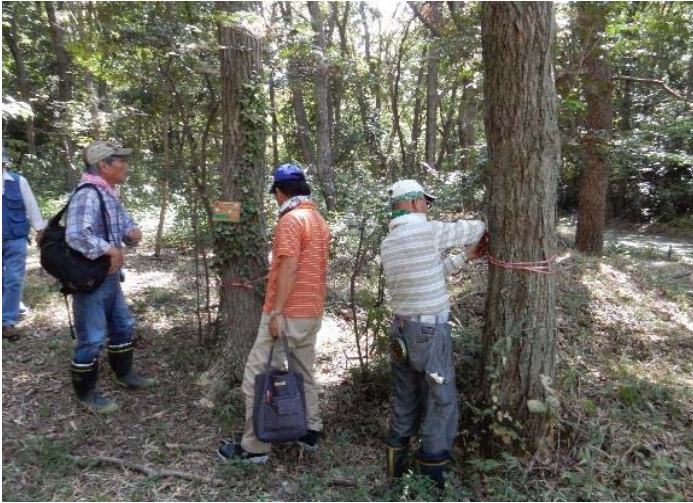
ナラ枯れ被害木の確認とテープ巻き