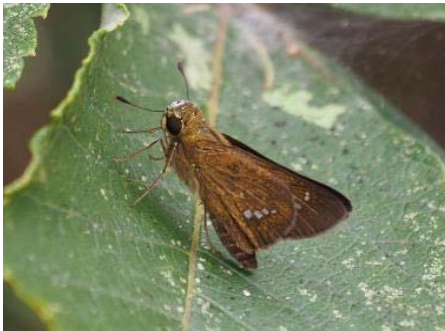
イチモンジセセリ