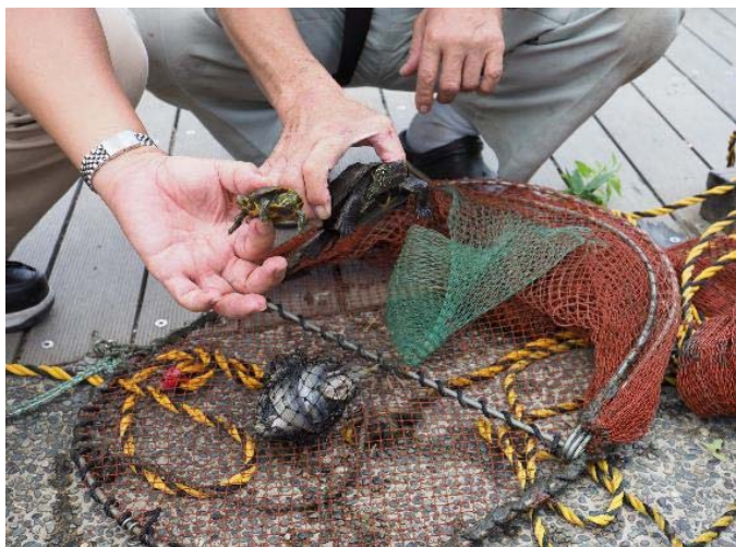
捕獲網に入っていたクサガメとアカミガメ