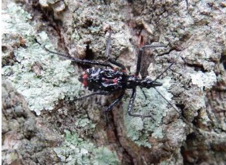
ヨコヅナサシガメの幼虫