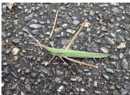
ショウリョウバッタ