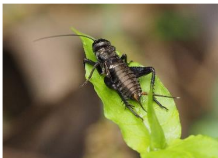
エンマコオロギの幼虫