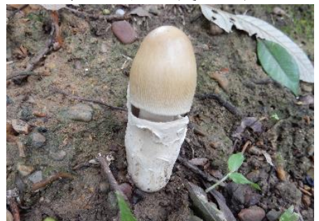
今日のキノコ(その18)