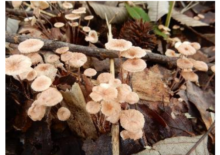
今日のキノコ(その12)