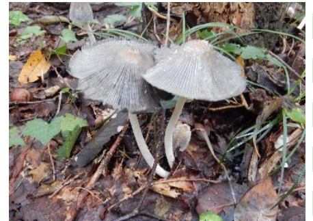
今日のキノコ(その9)