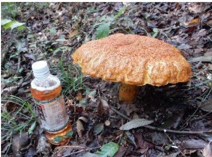
今日のキノコ(その10)