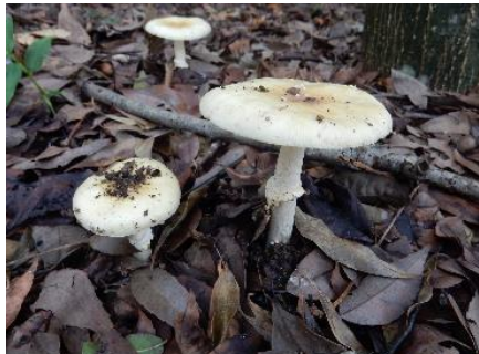
今日のキノコ(その14)