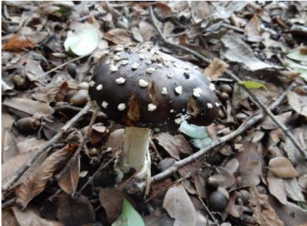
今日のキノコ(その13)