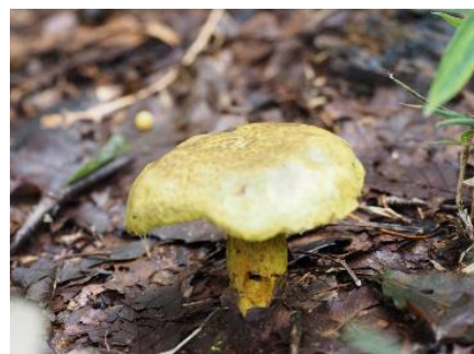
今日のキノコ(その2)