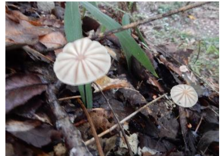
今日のキノコ(その15)