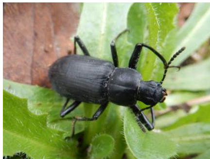
ユミアシゴミムシダマシ