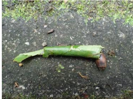
落ちていた摇篮(中は未確認)