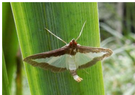
ワタヘリクロノメイガ