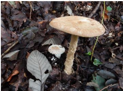
今日のキノコ(その16)