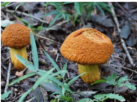
今日のキノコ(その1)