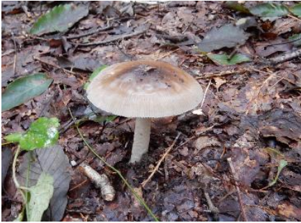
今日のキノコ(その7)