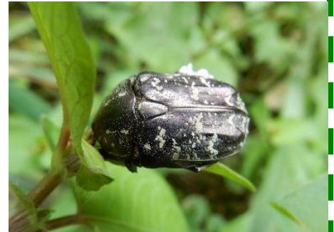
シラホシハナムグリ