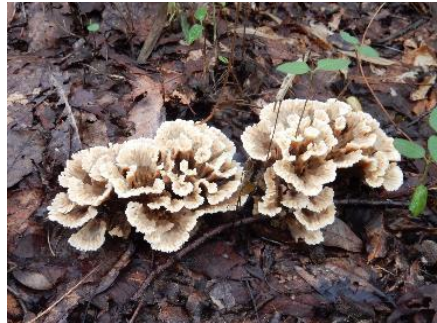
今日のキノコ(その8)