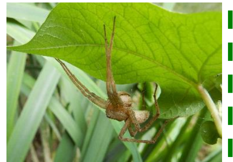
卵囊を抱えたイオウイロハシリグモ