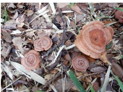
今日のキノコ(その4)