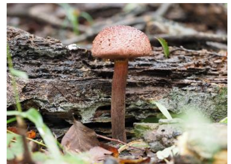
今日のキノコ(その3)