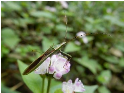
クモヘリカメムシ