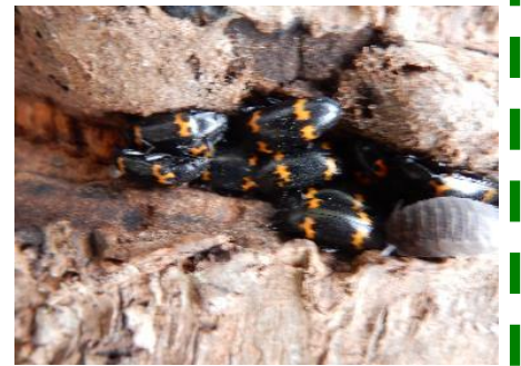
ミヤマオビオオキノコ