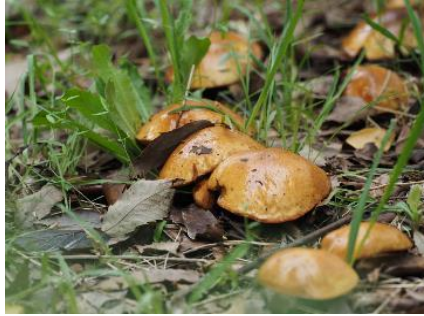
今日のキノコ(その11)