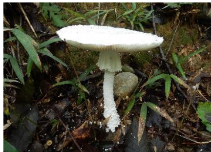
今日のキノコ(その5)