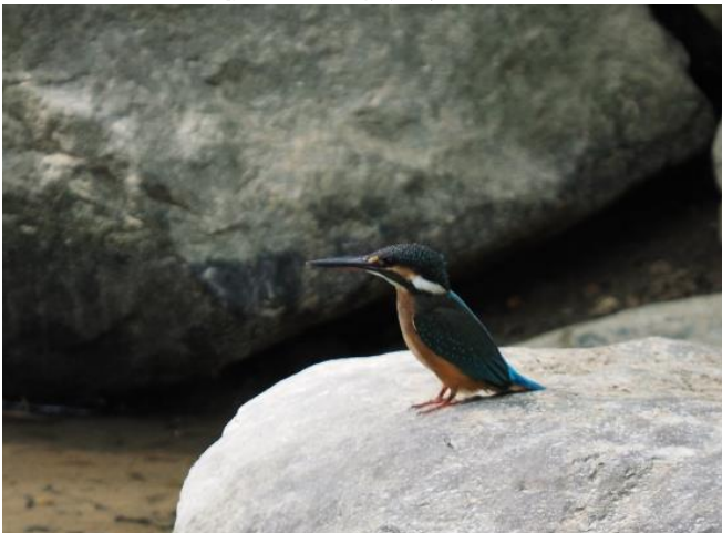
ロータリー横の池に姿を見せたカワセミ