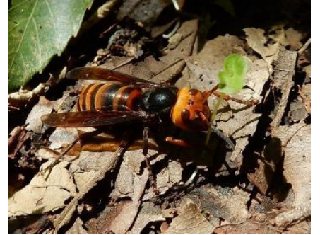
コガタスズメバチ