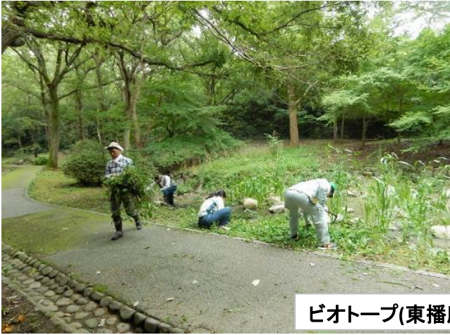
ロータリー横の池の草刈り作業(その1)