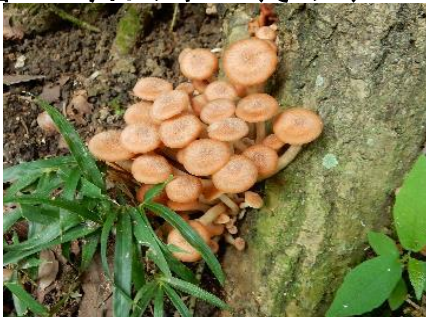
今日のキノコ(その2)