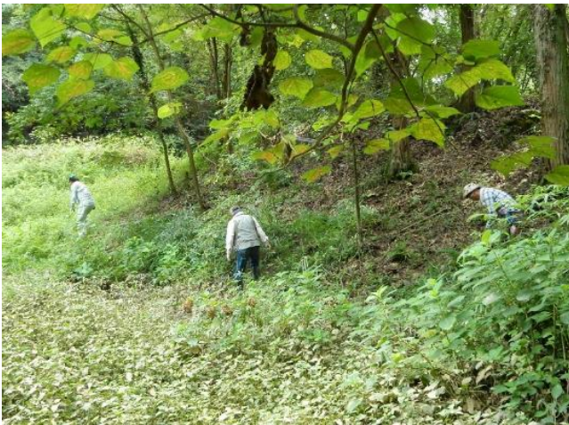
水源池周囲の草刈り作業