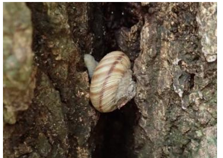
カタツムリのなかま