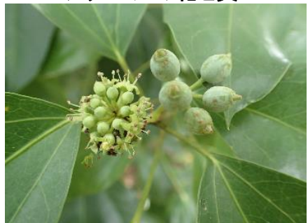
カクレミノの花と実