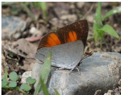
ウラギンシジミ(オス)