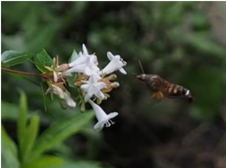
アベリアの花を訪れたホシホウジャク