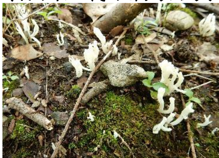
今日のキノコ(その4)ソウメンタケ