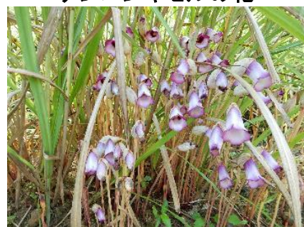
ナンバンギセルの花