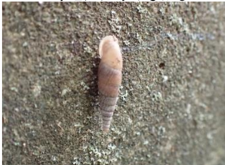
キセルガイのなかま