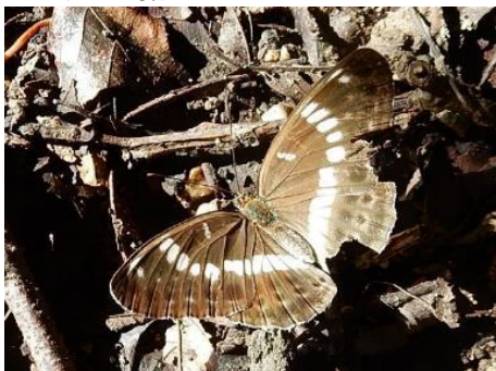
翅が傷んだアサマイチモンジ