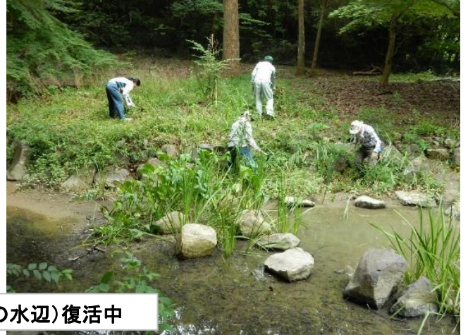
ビオトープ(東播磨の水辺)復活中