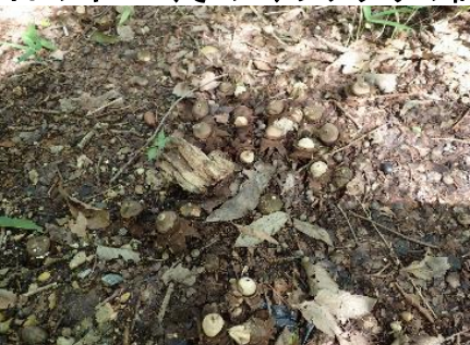
今日のキノコ(その1)ツチグリの群落