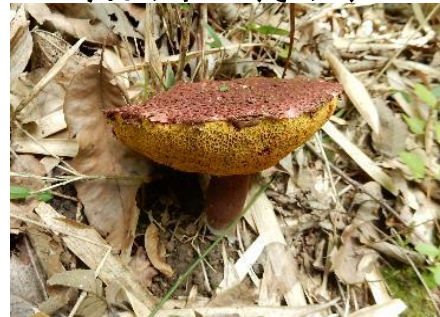
今日のキノコ(その3)