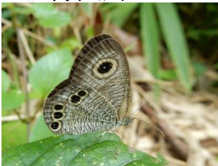
ヒメウラナミジャノメ