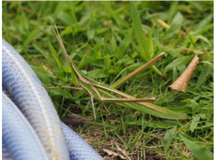
ショウリョウバッタ