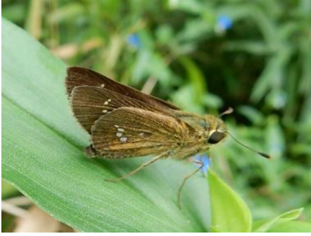
イチモンジセセリ