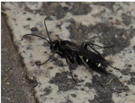
オオシロフクモバチ