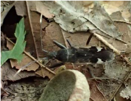
オオシロヘリナガカメムシ