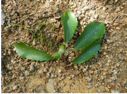
ハイロチョッキリがドングリに産卵して切り落としたコナラの枝