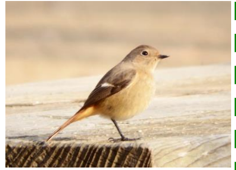
ジョウビタキ(メス)