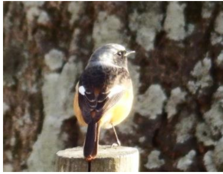
ジョウビタキ(オス)の後姿