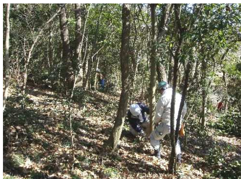
カクレミノ、 ヒサカキ、 ヤブニッケイを伐採