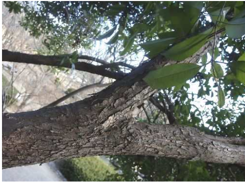
斜面から横に張り出した幹