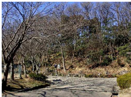
左:公園入口・グラウンド 手前:管理棟

● 午前 10時30分~12時 既に公園側で少し手入れされたあと、植生を見ながら整備 「C②ゾーン」