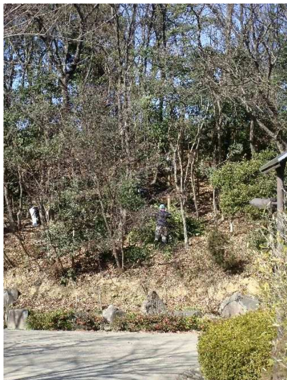
通路沿いの斜面が明るく風通しが良くなっていきます