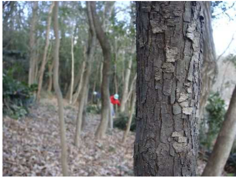
しゃしゃんぼの木肌