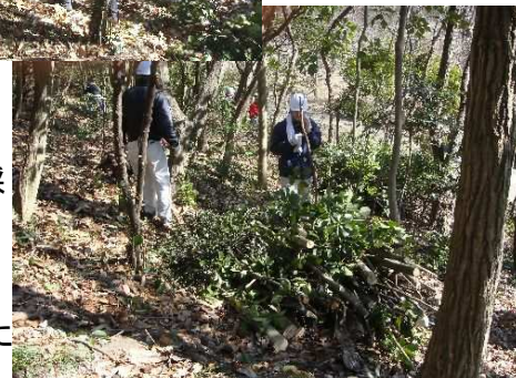
玉切りは 虫達の棲家に