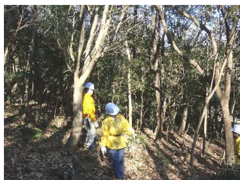
サクラやコナラに 絡まるような カクレミノを伐採